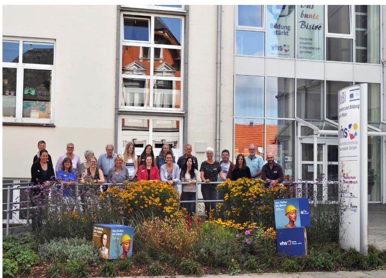
Das KVHS-Team vor unserem Gebäude KoBi in Brake

Bei Fragen, Ideen oder zur Themenfindung - Sprechen Sie uns gerne an! Vieles ist möglich.